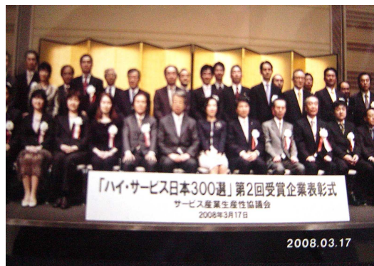
受賞企業表彰式の模様 (3月17日:大手町サンケイプラザにて)